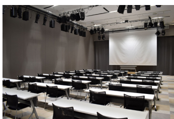
研修会(スケール形式)