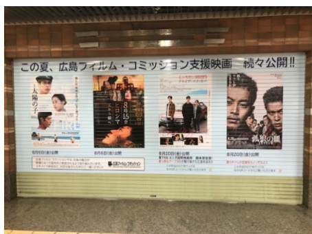
↑中央広場から東通りに入っすぐの店舗前のシャッター全面に、PRシートを展示中!