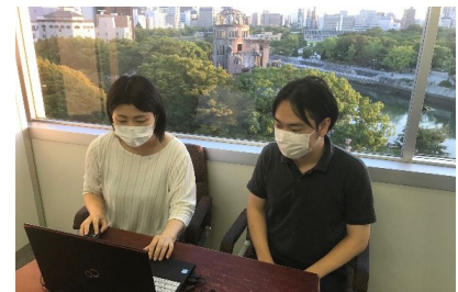
発表する当ビューロー職員

こうした貴重なご意見等を活かしながら、今後も MICE 推進部が一丸となり、広島でより多くの MICE が開催されるよう、積極的に取り組んでまいります。（MICE 推進部）