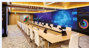
▲おりづるタワー5階 [2045 Future Presentation Room]