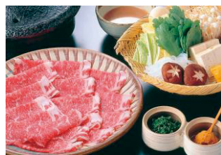
八雲名物「すすぎ鍋」

◆ひろしま八雲 TEL(082)244-1551 中区富士見町 4-9 広越本社ビル1・2F