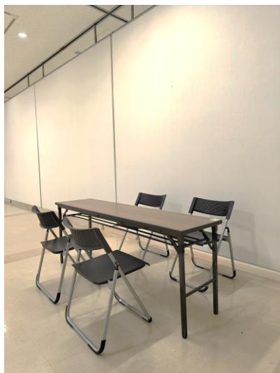
背面パネルブース