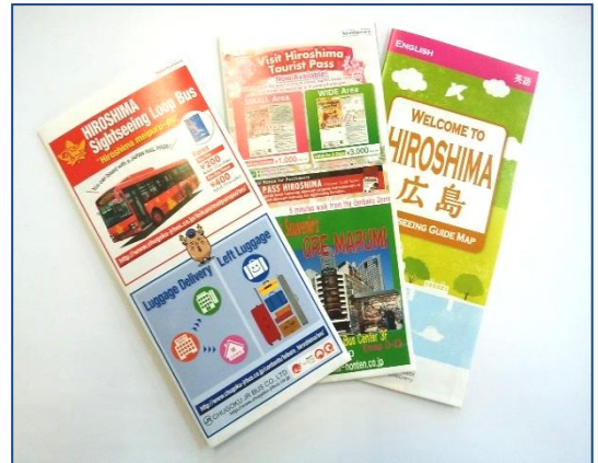
※画像は英語版です。