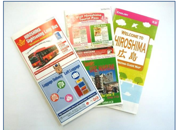
※画像は英語版です。